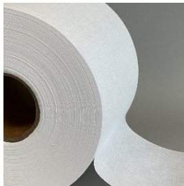
Telas no tejidas fundidas

Hilos elásticos como cordón hueco, cordones para tejer o también como cuerda elástica plana. Bandas nasales de PE sin incrustaciones de metal. Tejidos no tejidos fundidos como artículos en rollo.